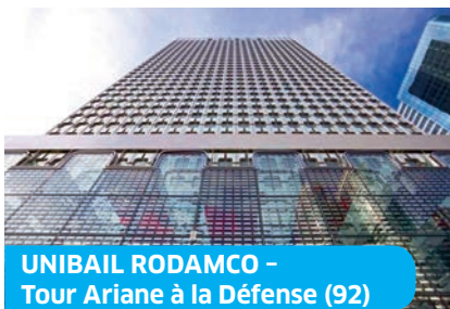
UNIBAIL RODAMCO - Tour Ariane à la Défense (92)

Garantie de Résultat Énergétique et de confort sur la durée des contrats