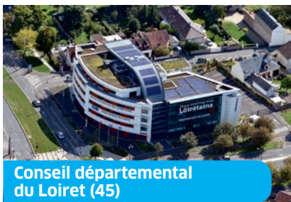
Conseil départemental du Loiret (45)