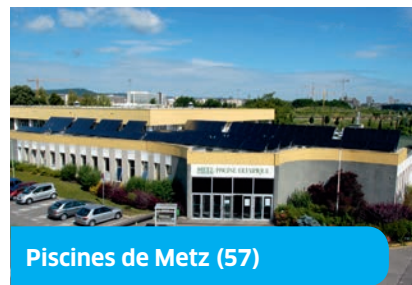
Piscines de Metz (57)