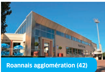
Roannais agglomération (42)