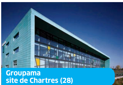
Groupama site de Chartres (28)